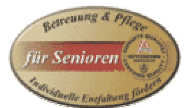
老年人护理机构 标识