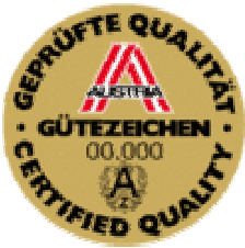
奥地利质量共同 促进会 质量标识