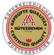
奥地利模范 公司标识