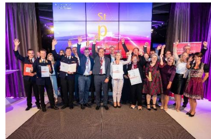
Abbildung 2: Staatspreisgewinner 2021

Die Gewinner werden im Rahmen der Winners' Conference vorgestellt und feierlich ausgezeichnet, neben dem*der Staatspreisträger*in werden auch die Categoriesieger*innen und Jurypreis Gewinner*innen geehrt.